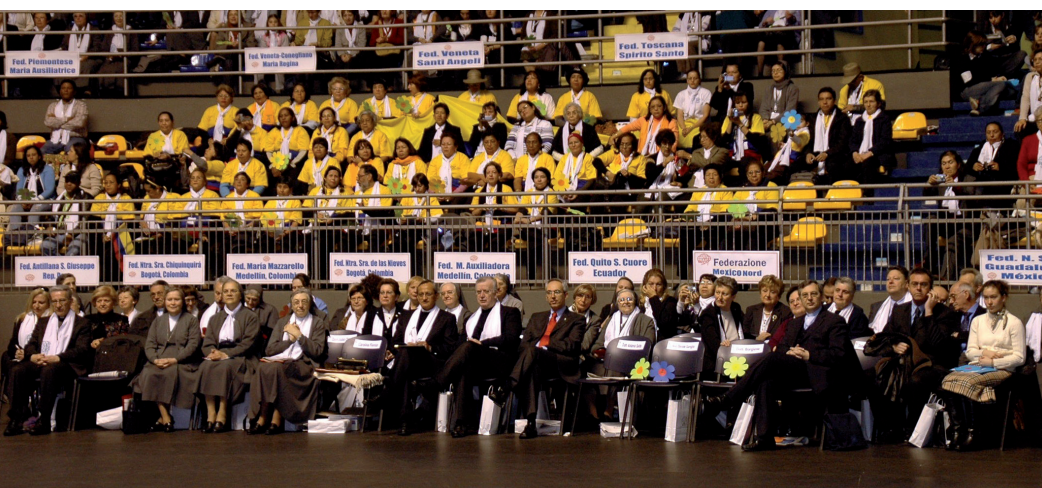
Centenario Fondazione Exallieve FMA (Torino 2009)