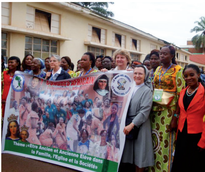
1° Congresso africano (2017)