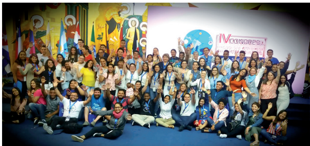
IV Congresso Americano a Santo Domingo