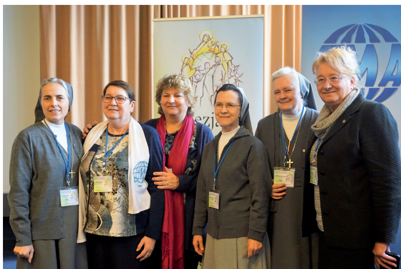
Presidente Confederale, Delegate e Consigliere Confederali in Polonia

delle FMA viene riconosciuta nell'art.74 delle Costituzioni. L'Associazione è stata costituita in Italia, con atto pubblico notarile in data 12 febbraio 1990, ai sensi dell'art. 36 e seguenti del Codice Civile, con il quale è stato approvato anche il primo statuto. Attualmente è in vigore quello approvato nella V° Assemblea Elettiva del 2015.