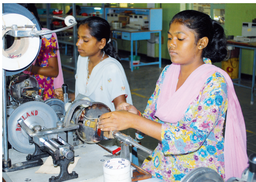
Bangalore. Promozione donna

Le Exallieve e gli Exallievi, nello spirito di Don Bosco e di Madre Mazzarello, prestano un'attenzione particolare alle bambine, alle donne, ai giovani, specialmente a quelli che si trovano in situazione di povertà o di esclusione, per coinvolgerli e renderli protagonisti della loro formazione integrale e della loro scelta vocazionale.