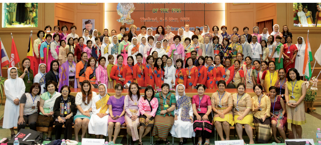
1° Congresso Asiatico (maggio 2013)