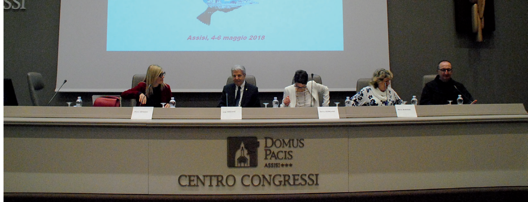
1° Convegno Nazionale italiano Assisi (2018)