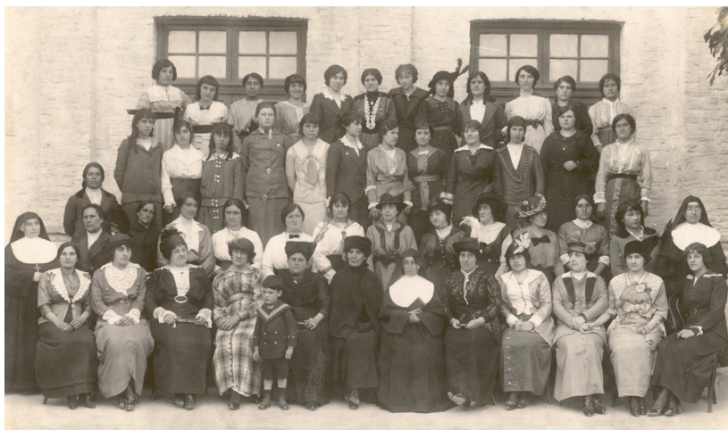
Exallieve 1914. Carmen de Patagones

Don Filippo Rinaldi nel 1911 affermerà in un incontro con le Direttrici FMA, riguardo all'Associazione: "Don Bosco l'avrebbe fatto, ma non erano maturi i tempi, ma se questa non fosse stata un'idea di Don Bosco, non avrei fondato l'Associazione".