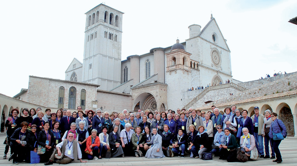
1° Convegno Nazionale Italiano ad Assisi (2018)