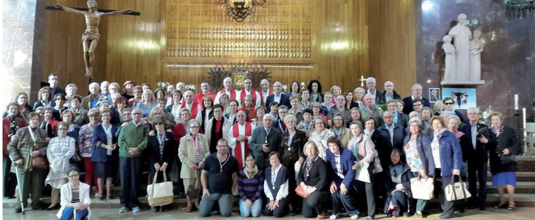
ADMA spagnoli a Madrid