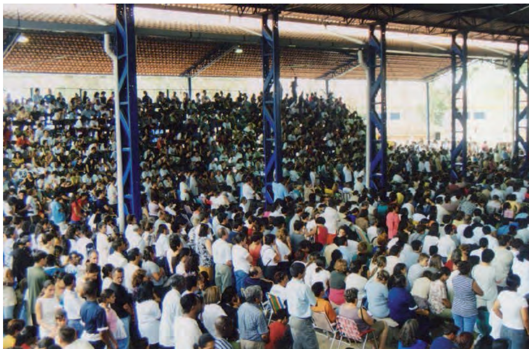
Primeiros acampamentos de oração em Rincão, nos anos 80.