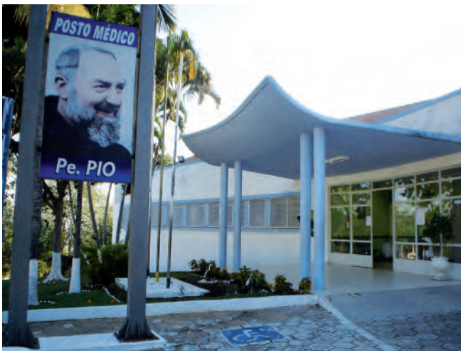
Centro médico “Padre Pio” em Cachoeira Paulista

núcleo da Comunidade. Os ensinamentos começam a ser gravados em cassetes, dando origem às primeiras gravações em áudio, que futuramente se tornariam o DAVI – Departamento de Audiovisuais.