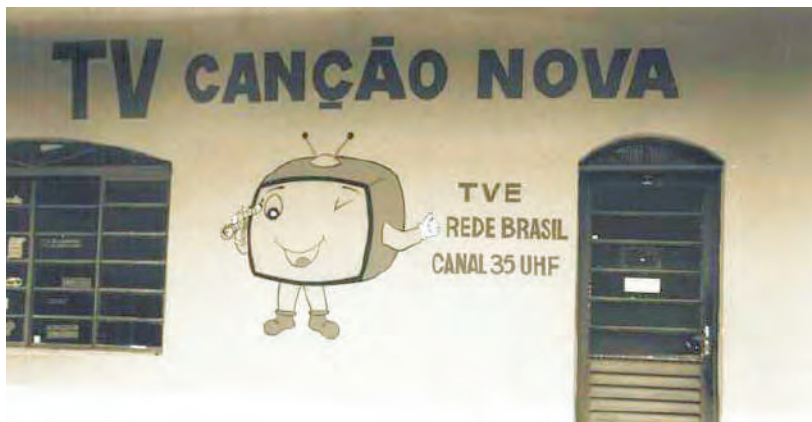
Primeiro prédio da TV Canção Nova

Seguindo Dom Bosco, a Comunidade Canção Nova está comprometida com o processo de formação permanente. O homem e a mulher estão sempre em crescimento humano e espiritual, até